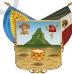
Estado Libre y Soberano de Hidalgo