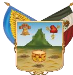
Estado Libre y Soberano de Hidalgo