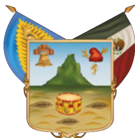
Estado Libre y Soberano de Hidalgo

TOMO CLIV Pachuca de Soto, Hidalgo 31 de Diciembre de 2021 Bis Trece Núm. 52