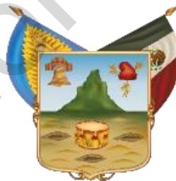
Estado Libre y Soberano de Hidalgo