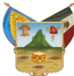
Estado Libre y Soberano de Hidalgo