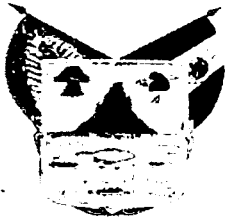
PODER LEGISLATIVO GOBIERNO DEL ESTADO DE HIDALGO