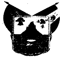
Poder Ejecutivo Estado Libre y Soberano de Hidalgo

JOSÉ FRANCISCO OLVERA RUIZ, GOBERNADOR CONSTITUCIONAL DEL ESTADO LIBRE Y SOBERANO DE HIDALGO, A SUS HABITANTES SABED: