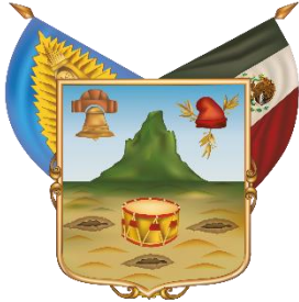
Estado Libre y Soberano de Hidalgo